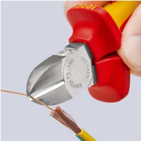
Rent snitt på tynne Cu-tråder, også på skjærspissene